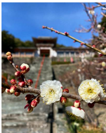
hiroki.1984さん (和歌浦天満宮)