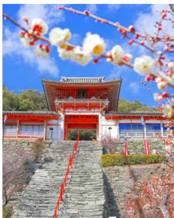
hashisoraさん (和歌浦天満宮)